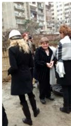
Architektinnen auf einer Baustelle in Tiflis

In einer Tour durch Tiflis, die die georgischen Architektinnen spontan organisiert haben, konnten wir die Arbeiten der Architektinnen und Bauhandwerkerinnen bewundern, die von der Rekonstruktion traditioneller Häuser bis zu interessanten Neubauten und der Gestaltung von Innenräumen reicht.