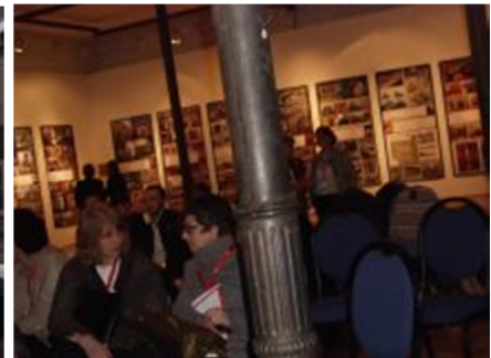
Veranstaltungsort Alte Karawanserei